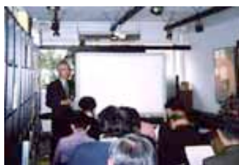
過去の報告会風景

初年度の後半、思わぬ病で 2 ヶ月間の治療で休んだ私に代わり、活動の維持に尽力頂いた世話人の皆さん、企画づくり・事務局業務・催事業務等に大きな助力を頂いてきたアドバイザー・会員の皆さん、今年開始の寄付事業に応じ多額なご寄付を頂いた皆さん。皆様のご理解とご支援が有って地域美産会の活動が 45 回も継続できたことを、心奥より感謝する次第です。