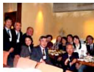
過去の交歓会風景

3 月は第 4 年度活動の最終月に当ることから、卒業期と学校休み期に入る後半を避けて、早目の 10 日 (土) を選び、① 午前中に、今期の活動内容を収支推移も含めての報告会、4 月から始まる第 5 年度活動の概括説明会、② 場所を変えて、45 回に達した美産会活動へのご支援感謝と参加者同士の交歓を目的に、「感謝午餐会」を外苑前「ウラク青山」で開催致します。