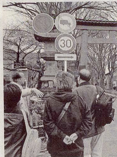
大宮氷川神社の一の鳥居。参道の樹木調査の結果などにも触れていた