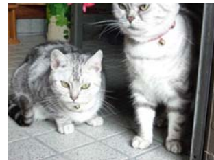
----- 「地域での生活」 -----